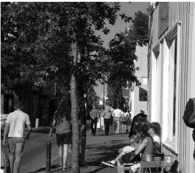
Folkvimlet på huvudgatan i Reykjavik en solig sommardag.

På ditresan fokuserade vi oss på de varma källorna, de s.k. gejsrarna vid "Blue Lagoon", vilket var fantastiskt! Området ligger på ett lavafält och dit tog vi oss med buss direkt från flygplatsen, vilket tog en dryg halvtimme. Vi hade gott om tid på oss att ligga och njuta och plaska omkring i det varma vattnet, rikt på mineraler som kiseldioxid och svavel, vilket sägs hjälpa många med hudsjukdomar som psoriasis. Lagunen ligger i anslutning till ett geotermiskt kraftverk, som den får vatten från. Det är en blandning av söt- och saltvatten och tas från ett djup på ca 2 km.