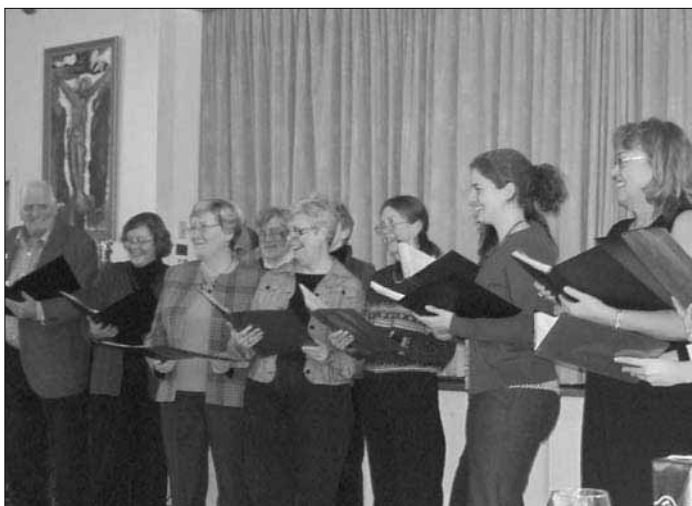
Svenska kören tar ton!