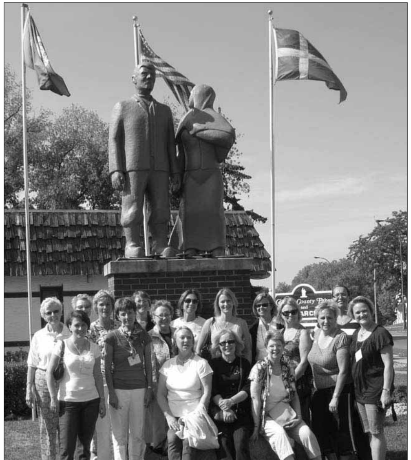
Swear framför statyn av Karl-Oskar och Kristina.