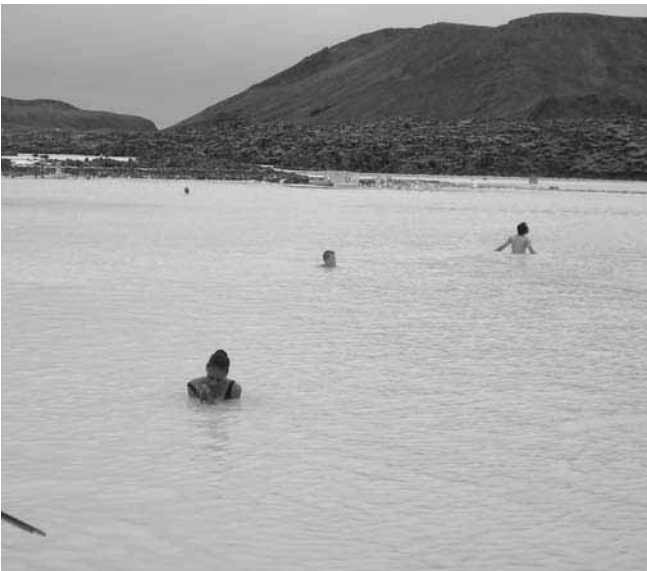
Ljuvligt varma bad i de s.k. gejsrarna vid "Blue Lagoon" på Island.

Då vi åkte var det fortfarande rätt dyrt på Island, men saker och ting har som bekant förändrats mycket sedan dess... Flygturen från Toronto till Reykjavik tog drygt 5 tim. Resan från Reykjavik till Köpenhamn tog knappt 3 tim. Man kan naturligtvis välja hur långt stopp man vill göra på Island och vi valde ett heldags-uppehåll, vilket kändes lagom för oss.