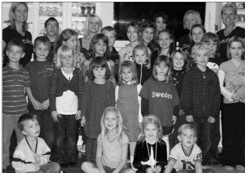
Några av eleverna och eldsjälarna vid Swedish School Halton

Vi har även en distansgrupp för barn som bor utanför vår region. För dessa barn erbjuder vi en elev-webb där de kan logga in för att få studieuppgifter och information.