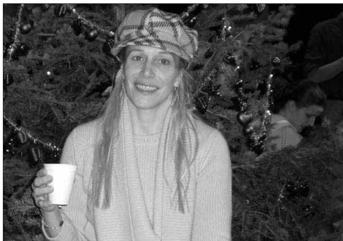
Kimeja—en av besökarna på julmarknaden tar sig en glöggpaus i folkviolet