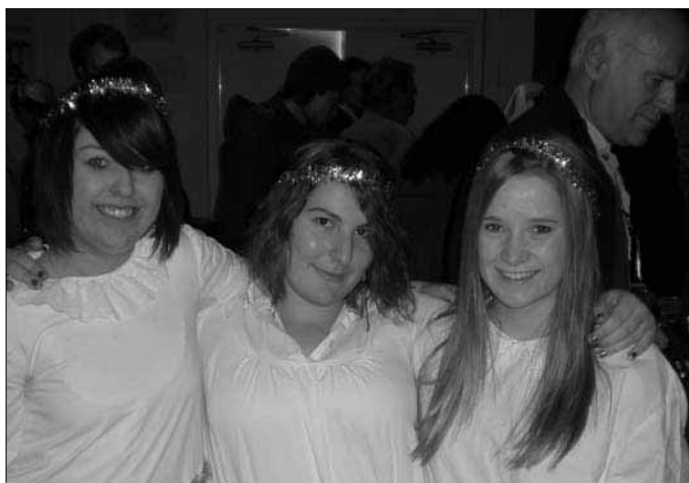
Tärnor på vift i julmarknadsviolet