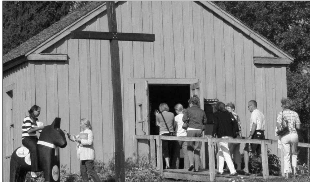
Lekfulla Swear besöker Gammelkyrkan i Scandia, byggd 1856 men församlingen växte ur den redan 1860. Sen var det en hölada tills den blev museum.