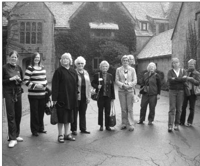
Regionmöte i Michigan