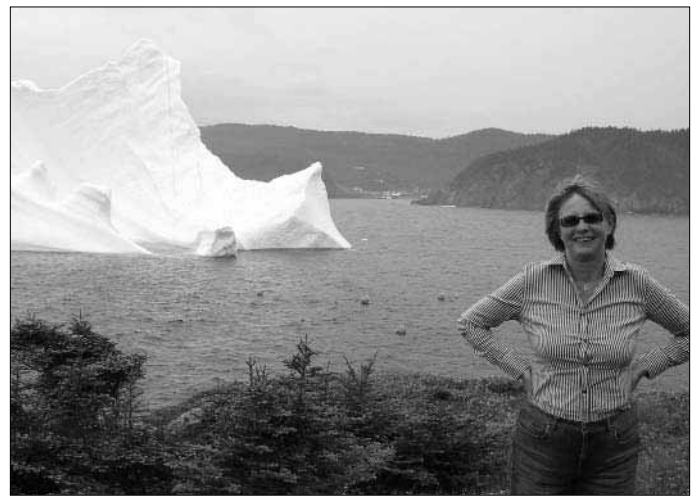
Ambassadör "on the rocks". Trinity Bay , Newfoundland i början av juli 2008.