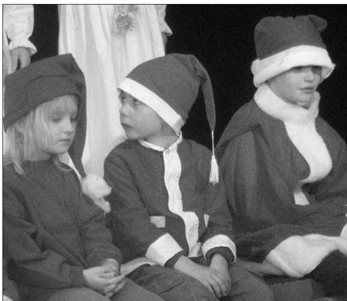
Tre små tomtenissar