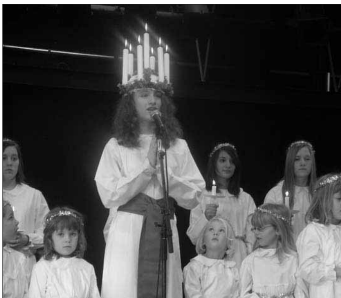
Lucia med sina tärnor