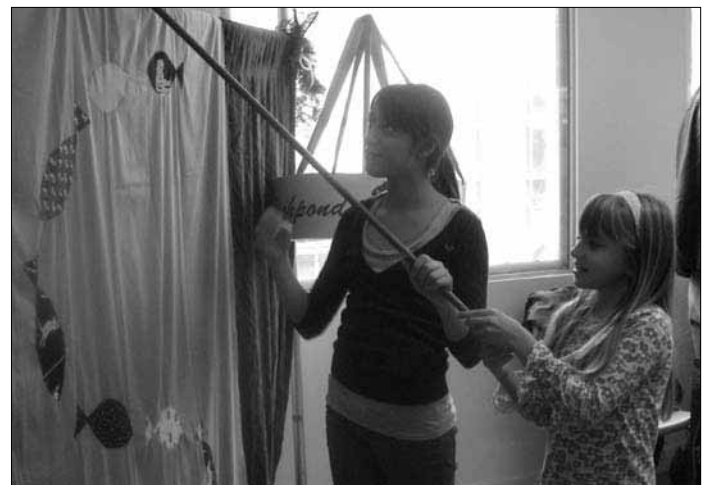
Höga förväntningar vid fiskdammen