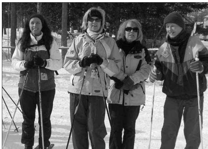
Skidhelg i Wasaga Beach