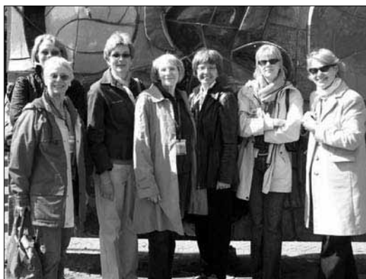
Världsmötet i Amsterdam

I maj månad hade vi ett Allmänt Möte för att bestämma vart pengar avsatta till en Jubileumsfond skulle användas till. Majoriteten röstade på att pengarna skulle