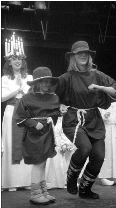
Dans med pepparkaksgubbarna